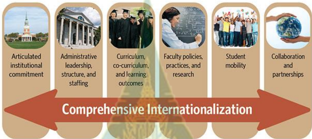
ภาพที่ 2.2 โมเดล CIGE เพื่อความเป็นสากลสมบูรณ์แบบ

3) โมเดลความเป็นสากลสมบูรณ์แบบของศูนย์ความเป็นสากลและความผูกพันระดับโลก (CIGE Model for Comprehensive Internationalization) พัฒนาโดย Center for Internationalization and GlobalEngagement (2014) ( http://www.acenet.edu/Pages/default.aspx ) ประกอบด้วยเป้าหมายหกประการที่เชื่อมโยงกันในการดำเนินการของสถาบัน 6 ด้าน ได้แก่ ความรับผิดชอบต่อองค์กร ภาวะผู้นำเชิงบริหาร โครงสร้างและบุคลากร หลักสูตร หลักสูตรร่วมและผลลัพธ์ของการเรียนรู้ นโยบายเกี่ยวกับอาจารย์ การปฏิบัติและการวิจัย การย้ายถิ่นนักศึกษา ความร่วมมือและหุ้นส่วน