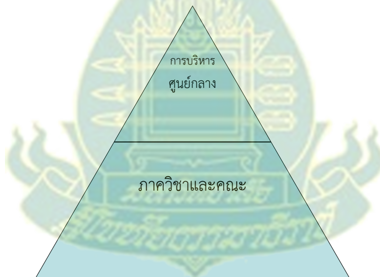
ภาพที่ 2.1 Neave's model